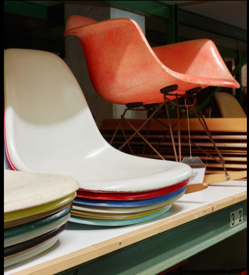
Collection Eames, Vitra Design Museum, Schaudapot

Le lien et la collaboration intenses entre l'Eames Office et Vitra se poursuivent encore aujourd'hui à travers la troisième génération des deux familles. Après avoir initialement travaillé avec Lucia Eames, Vitra consulte désormais Eames Demetrios, le petit-fils de Charles et Ray, pour la production de modèles Eames authentiques et la communication autour de leur œuvre. La présence de Charles et Ray Eames chez Vitra ne se ressent pas seulement dans la connexion avec leurs meubles. La philosophie du design des Eames continue en effet de façonner en profondeur les valeurs, l'orientation et les objectifs de l'entreprise. Une influence qu'incarne bien la question récurrente de Rolf Fehlbaum : Que dirait Charles ?