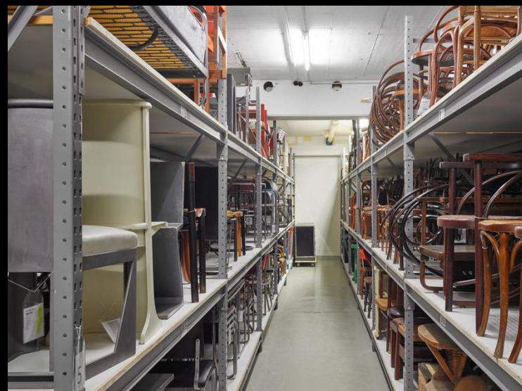
Collection du Vitra Design Museum