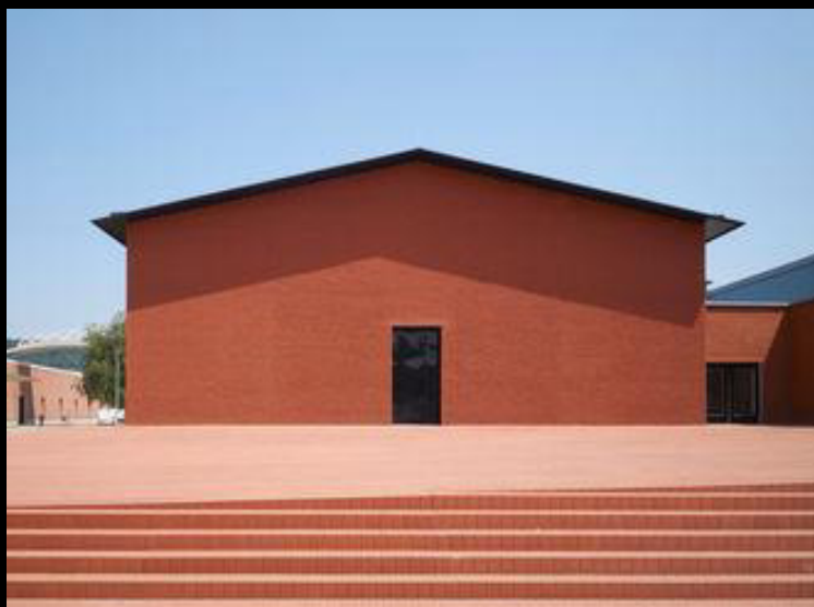
Vitra Design Museum, Schaudepot

Charles et Ray Eames pourraient bien être les créateurs les plus marquants du 20 e siècle. Depuis la fondation du Vitra Design Museum, leur travail constitue la pierre angulaire de la collection. Nous nous sommes plongés dans les archives du musée pour redécouvrir les histoires qui se cachent derrière leurs créations et apporter un nouvel éclairage sur leurs œuvres les plus connues, vénérées aujourd'hui comme des classiques du design.